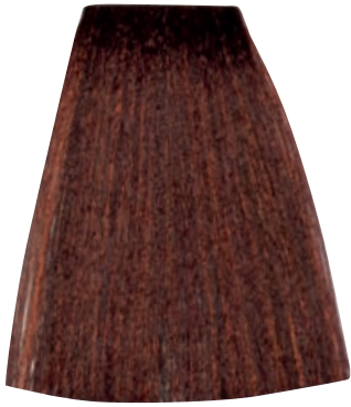
CASTANO CHIARO RAME