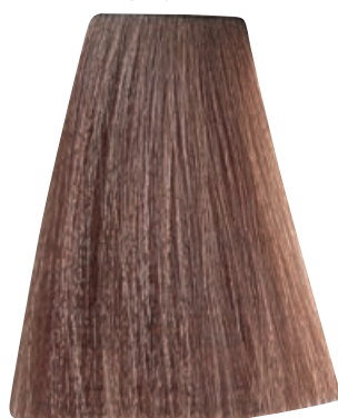
BIONDO CHIARISSIMO DORATO RAME