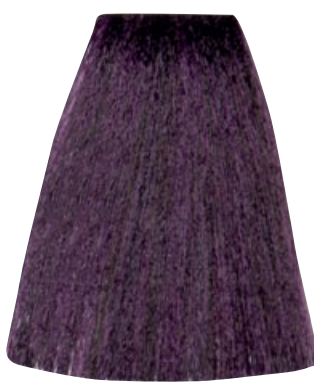
BIONDO SCURO VIOLA INTENSO