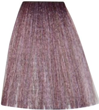
BIONDO CHIARISSIMO CENERE IRISÉ