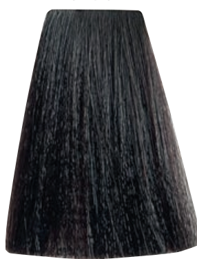
CASTANO CHIARO DORATO MOGANO