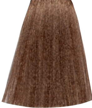
BIONDO CHIARISSIMO DORATO