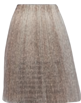
BIONDO NATURALE PLATINO