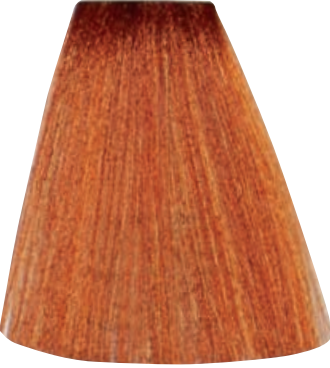
BIONDO CHIARO RAME