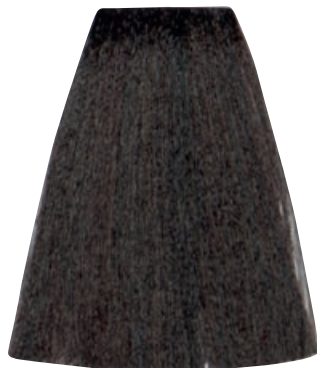
BIONDO SCURO CENERE