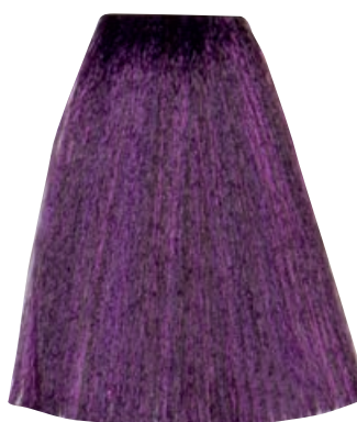
BIONDO VIOLA INTENSO