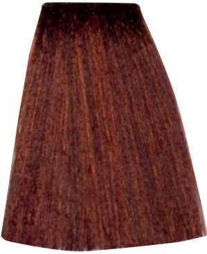
BIONDO SCURO RAME