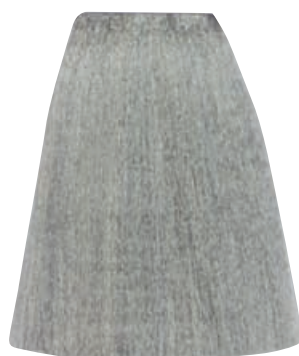
BIONDO CENERE PLATINO