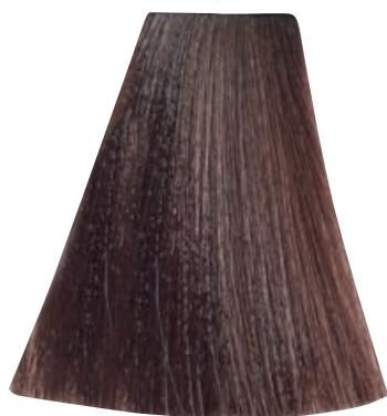
BIONDO DORATO RAME