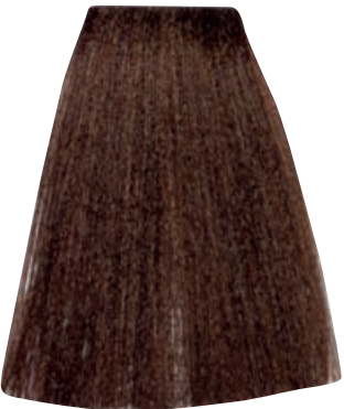
BIONDO SCURO DORATO