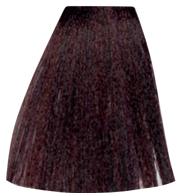
CASTANO CHIARO ROSSO INTENSO