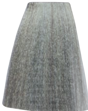
BIONDO EXTRA CHIARO CENERE