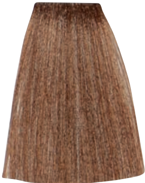
BIONDO CHIARO DORATO