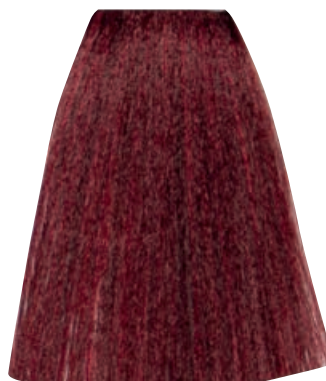
BIONDO ROSSO INTENSO