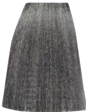
BIONDO CHIARISSIMO CENERE