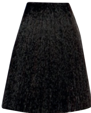
CASTANO CHIARO CENERE