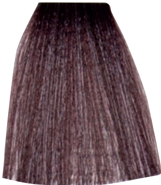
BIONDO CENERE IRISÉ