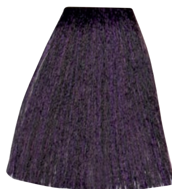
CASTANO CHIARO VIOLA INTENSO