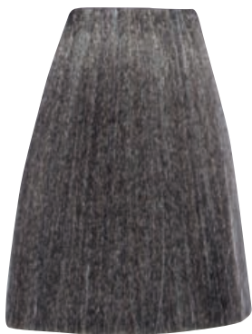
BIONDO CHIARO CENERE