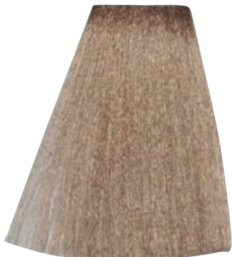
BIONDO EXTRA CHIARO